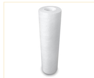
Foto indicativa. La scelta dell'attacco e delle misure comporteranno l'assemblaggio di un prodotto che potrebbe differire da quanto mostrato in figura