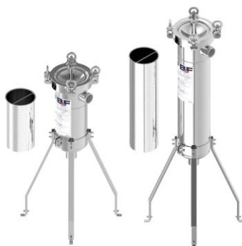
Foto indicativa. La scelta dell'attacco e delle misure comporteranno l'assemblaggio di un prodotto che potrebbe differire da quanto mostrato in figura